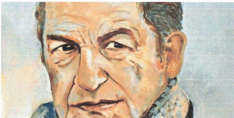
Acrylbild ohne Titel der Künstlerin Christiane Leptien.

Die Internationale Kunstausstellung Form-Art in Glinde hat sich zu einer Plattform für zeitgenössische Kunst vor den Toren Hamburgs entwickelt. Etwa 1000 Werke von 42 Künstlern aus acht Nationen werden am kommenden Wochenende zur 27. Form-Art zu sehen sein.