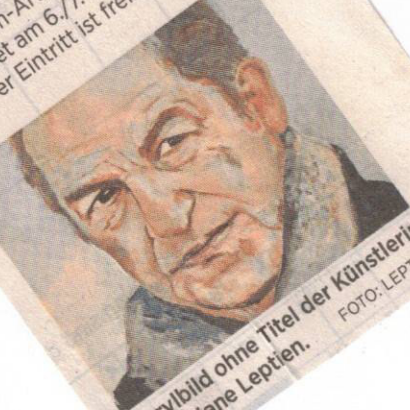
Acrylbild ohne Titel der Künstlerin Christiane Leptien.

Info 27. Internationale Kunstausstellung Form-Art, Markt 2, in Glinde. Geöffnet am 6./7. April, 11 bis 18 Uhr. Der Eintritt ist frei.